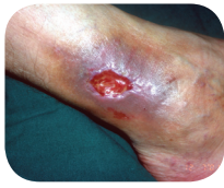
Na 3 weken Bioptron®- therapie