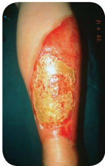
Diep tweede- graads brand- wond door kokend water