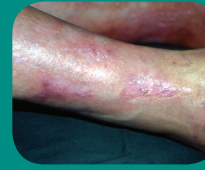
Volledige wondsluiting na 3 maanden Bioptron®-therapie