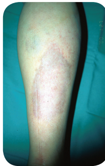
Follow-up na 9 maanden