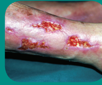
Na 2 weken Bioptron®-therapie