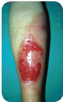
Na 18 dagen Bioptron®- therapie